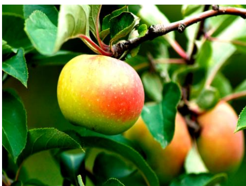
mele rosa dei Monti Sibillini

La proposta si propone l'obiettivo di contribuire alla crescita e lo sviluppo delle realtà produttive locali del settore agro-alimentare , attraverso l'organizzazione del circuito fieristico montano , che si concretizza in periodiche fiere espositive, forum e convegni, ospitati di volta in volta negli undici Comuni della Comunità Montana.