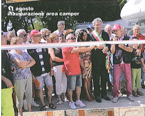
11 agosto inaugurazione area camper