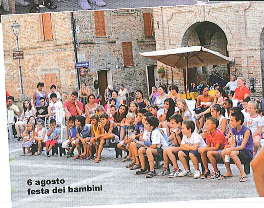
6 agosto festa dei bambini