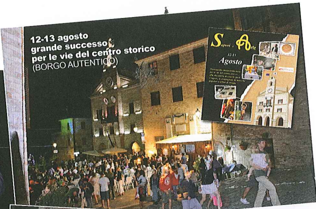
12-13 agosto grande successo per le vie del centro storico (BORGO AUTENTICO)