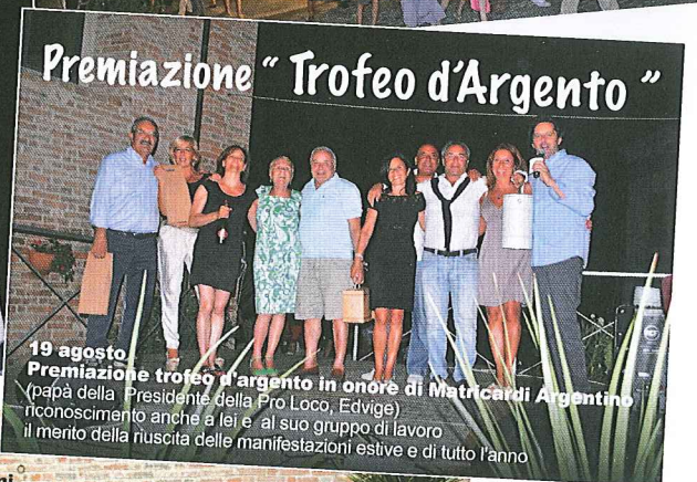
Premiazione "Trofeo d'Argento"