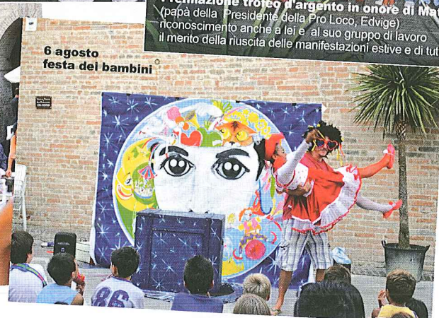
6 agosto festa dei bambini